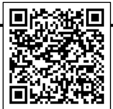
Retrouve Selma en vidéo