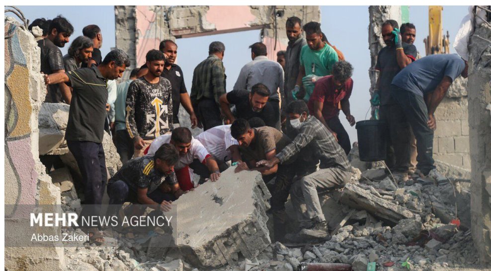
MEHR NEWS AGENCY Abbas Zakeri

Et pourtant, que ce soit en Afghanistan, en Irak, en Libye, au Mali ou en Centrafrique (pour ne prendre que les guerres les plus destructrices du XXI e siècle), les « libérateurs » impérialistes ont semé la destruction, la mort et la misère. Ils ont enterré sous les bombes les espoirs de révolution et, lorsqu'ils n'ont pas fini par s'arranger avec les dictatures pourries, ils les ont remplacées par un chaos de bandes armées encore plus dangereuses.