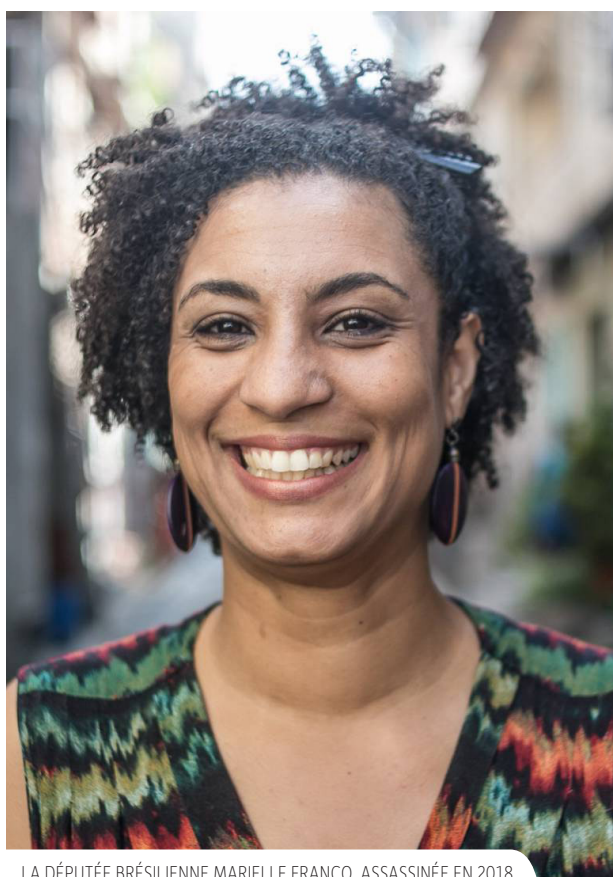
LA DÉPUTÉE BRÉSILIENNE MARIELLE FRANCO, ASSASSINÉE EN 2018