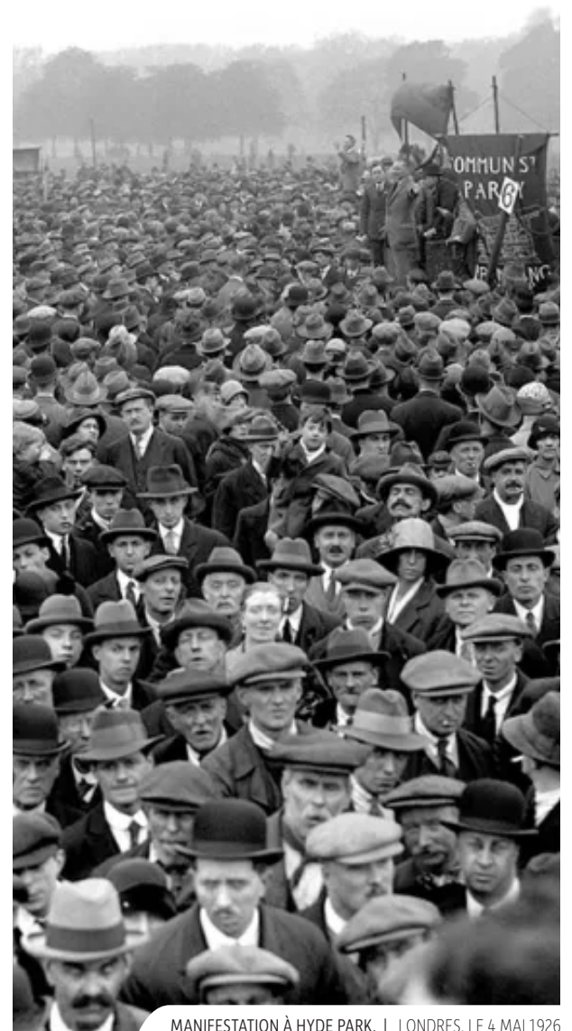
MANIFESTATION À HYDE PARK. | LONDRES, LE 4 MAI 1926