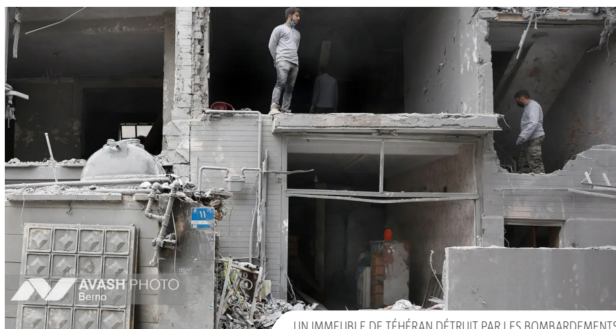
UN IMMEUBLE DE TÉHÉRAN DÉTRUIT PAR LES BOMBARDEMENTS.