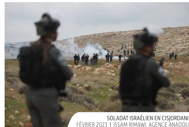
SOLADAT ISRAËLIEN EN CISJORDANIE FÉVRIER 2023

massive - entre 5 et 6 millions d'Albanais vivent hors des frontières du pays -, les regards peuvent se porter sur le contexte social dans toute la région : deux mouvements sociaux énormes en moins de trois ans en Serbie, des manifestations massives contre la corruption en Roumanie et en Bulgarie, la défaite d'Orbán en Hongrie, qui fait suite à des manifestations massives, et plusieurs journées de grève générale en Grèce suite à l'accident ferroviaire mortel de 2023. Une série de mobilisations populaires que certains ont déjà qualifié de « printemps des Balkans ». Dans ce contexte régional bouillonnant, chaque nouveau coup de colère pourrait mettre le feu aux poudres et provoquer un embrasement social régional. On ne peut que l'espérer !